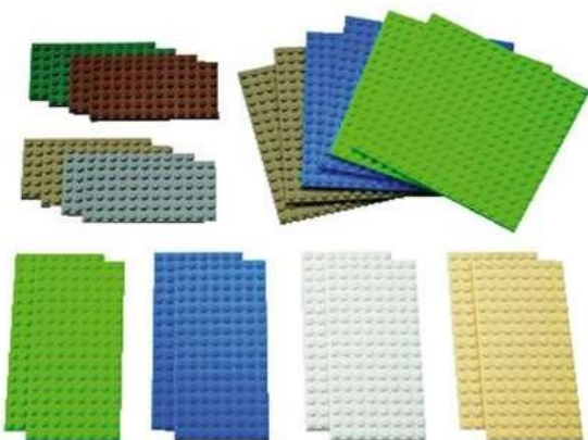
Большие и маленькие пластины, платы