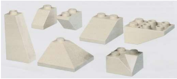
Скошенные кирпичи, клювики