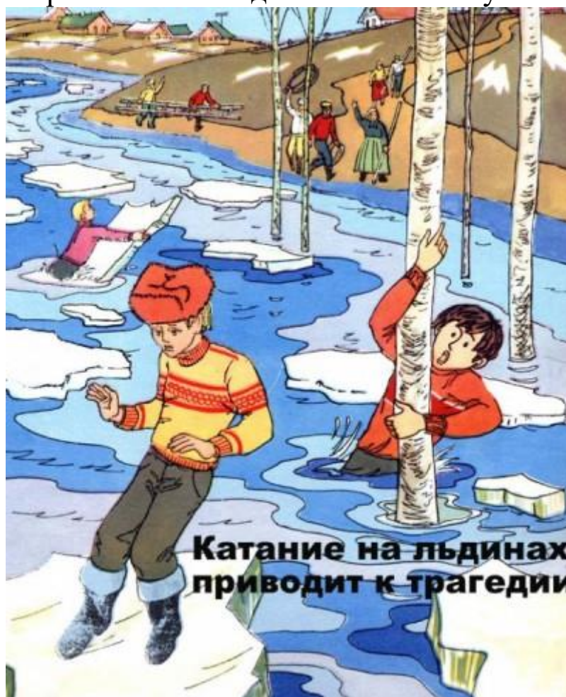
Катание на льдинах приводит к трагедии

Приближается время весеннего паводка. Лед на реках становится рыхлым, «съедается» сверху солнцем, талой водой, а снизу подтачивается течением. Очень опасно по нему ходить: в любой момент может рассыпаться под ногами и сомкнуться над головой.